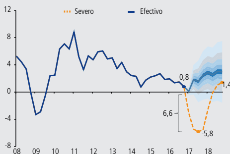
GRÁFICO IV.11 Crecimiento anual del PIB (*) (trimestral, porcentaje)

Los ejercicios de tensión se basan generalmente en situaciones extremas pero plausibles. En este contexto, los resultados reportados en los IEF de los últimos cuatro años, utilizan un escenario de tensión que replica una caída promedio de la actividad en periodos de fragilidad financiera. Dicho escenario —que denominaremos severo para efectos de este recuadro— considera una desaceleración del crecimiento del PIB de 6,6pp en tres trimestres a partir del período de referencia. Adicionalmente, se supone un nivel de convergencia para el crecimiento del PIB hacia los 2 años, el cual tiene una diferencia similar a la del crecimiento promedio previo y posterior a la crisis asiática. Así, en el ejercicio actual el escenario severo considera que el crecimiento del PIB converge a 1,4% anual (línea discontinua, gráfico IV.11).